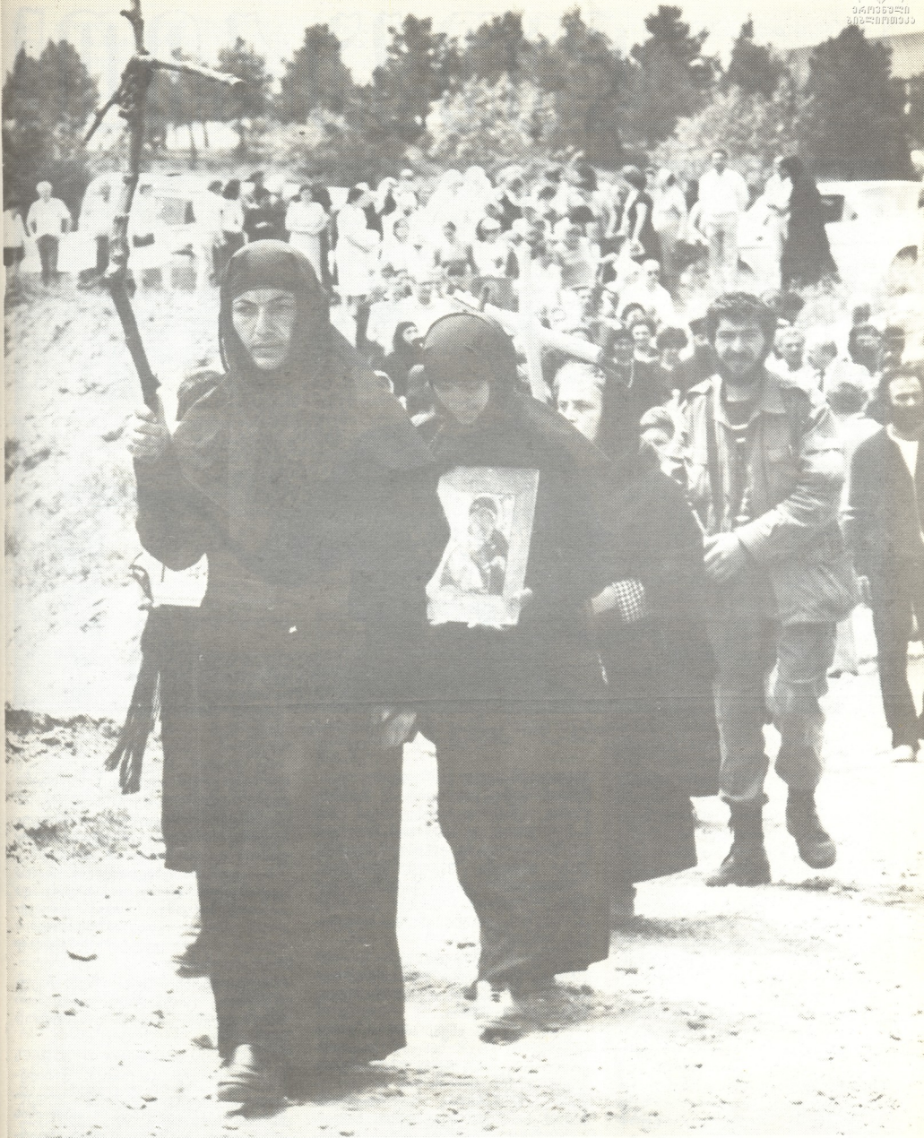
მორწმუნეთა მსვლელობა წმინდა ნინოს ნაკვალევზე