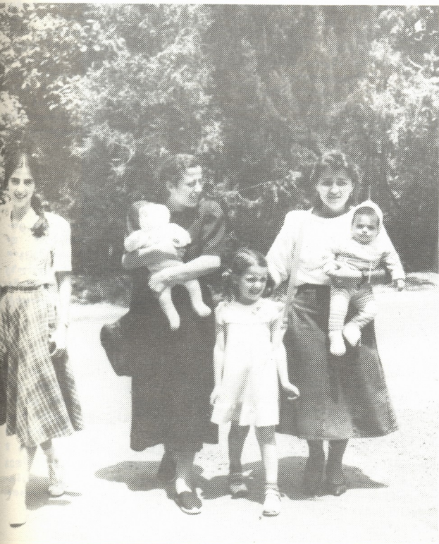
ღამით იპარაზვილის ფოტოები