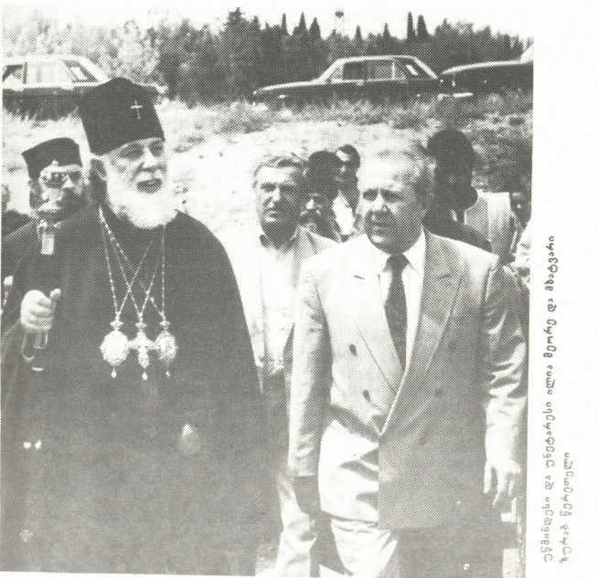
უწმინდესი და უნეტარესი ილია მეორე დ. მხატვარი ზურაბ წერეთელი