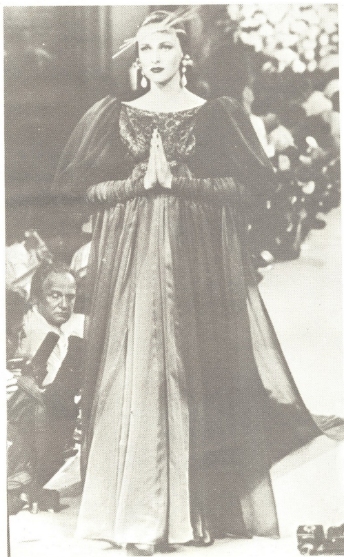
სურათზე: მემანეკენე ხილვია წარმოადგენს ივ-სენ-ლორანის საქორწილო კაბას.

პარიზში გაიმართა ზამთრის სეზონის ტანსაცმლის კოლექციის ჩვენება. საინტერესო მოდელები წარმოადგინა ცნობილმა ფრანგმა მემოდელემ ივ-სენ ლორანმა, რომლის საქორწილო ტანსაცმელი შედგენილია წითელი ფარჩის, მწვანე კაბისა და მუსლინის ვულისაგან.