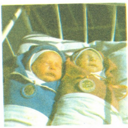
და... მაინც დავიბადე! დემდე ახალ 1990 წელს ფებლავებ მოვყავი.

— ოჰ, ოჰ, რა ბებიია ამირანია, ნამდვილი ამირანი, შემთავაზა ხელში ბებიაკალმა, ერთი კი დაანახვა ჩემი თავი დედას და სასწორისაყენ გამაქანა.