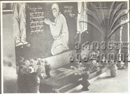
თამარ ქაიკულაძის საფლავი