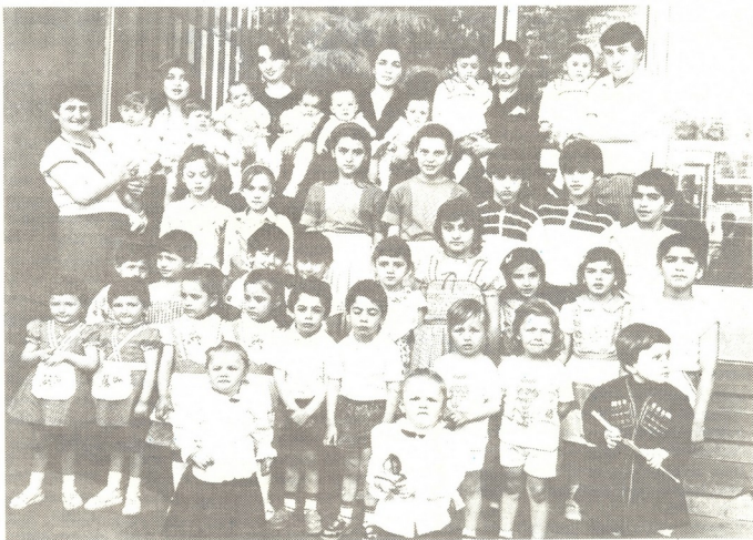
პალაშე პანკაშვილის ფოტოგრაფი