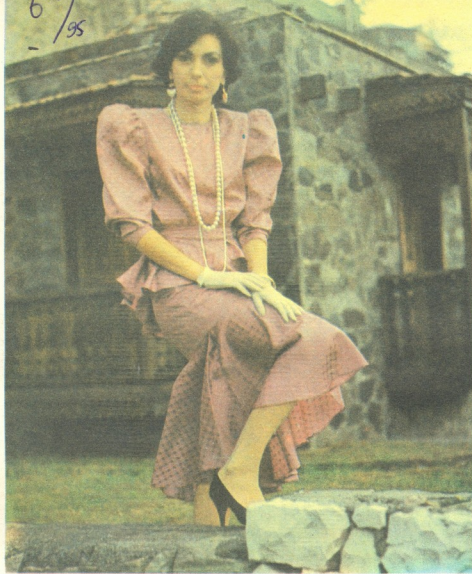
შპნი 80 533.