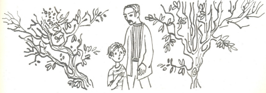
მხატვარი ვანო დეიხანძაძე

ზინდი კი დინჯად, ღვთისსაგან ეურთხეულ კაცზე დამუკერპული სიკვლეობითი, აუჩქარებულად მოიწვედა მალდა.