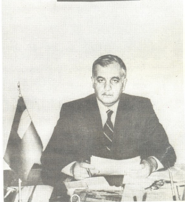
● 1991 წლის 14 აპრილს ზვიად გამახარდიამ ერთხმად აირჩიეს სა- ქართველოს რესპუბლიკის პრეზიდენტად. „საქართველოს ქალის“ რედაქცია თავის მრავალრიცხოვან მკითხე- ლებთან ერთად გულითადად ულოცავს ბატონ ზვიადს და უხურავს მას დიდ ბედნიერებას თავისივე საქართველოში.