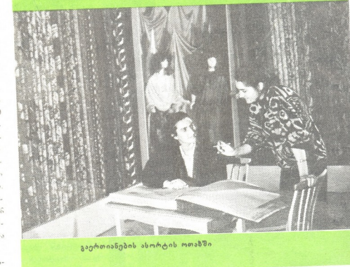
გავრთიანების ანობრის ოთახში

ჩავარდნილი ეკონომიკა ფეხზე წა-მოგვეყვებინა, მაგრამ როგორ, რა გზით?