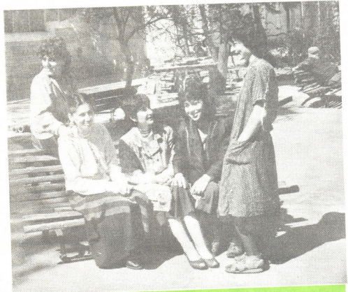
ქუთაისის აბრეშუმის საწარმოო გავრთიანების მუშები

და აი, პირველი, რაც გავაყვეთ, ის იყო, რომ დავხსდით და ვინაგრბი-მეო (მე პრეფიხითი ფინანსისტე ვარ), რა შესაძლებლობები გავაქარბდა, რო-გორ უნდა წარგვემართა იმისი, რომ