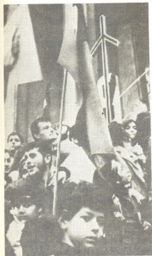
● 1991 წლის 9 აპრილი რუსთაველის კოსპოპო