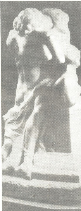
არდენი „რომში და უაღრიბა“

კულტურული ფაქტორი: დადებითი როლი განსაკუთრებით მაშინ მქონდება, როდესაც წვეილა ინტერესები და მოთხოვნილებები (კულტურულ სფეროში) ერთნაირი ან მხავავია. თუ ინტერესები და მოსწრაფებები მკვეთრად არის განსხვავებული, მაშინ მათ უნდა ეყადონ მათებნიშ შეყხების