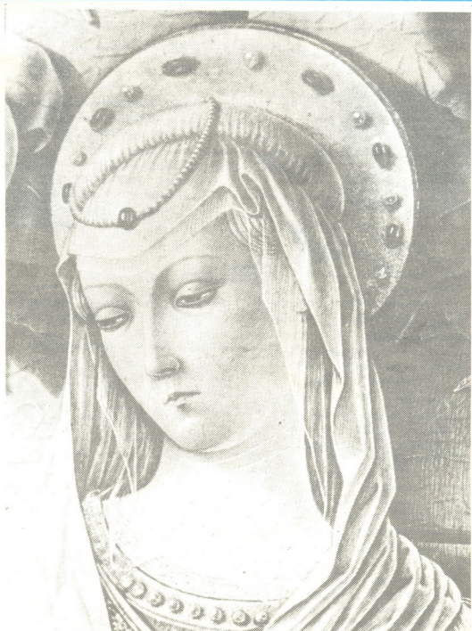
კარტიკონი — მარიამი (თეოდორე)

წინასწარმეტყველები ლაპარაკობდნენ იმ უბედურებებზე, რაც ებრაელ ხალხს დაატყდებოდა თავს ცოდვებისათვის — გაპარტახებაზე, ტყუობაზე, უცხოელთა პატონობაზე. მათ იწინასწარმეტყველეს, რომ ღმრთი გამოგზავნის ღვლამიწაზე მესიას — ქრისტეს — მხსნელს.