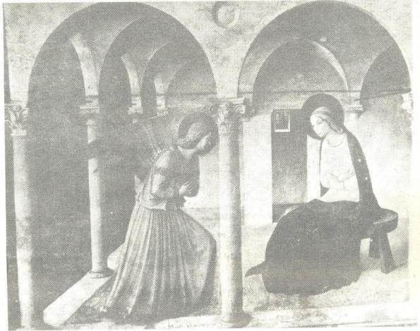
ფრა ანგელიკო — ხარება

მარიამმა განავრძობ: „მე მსახური ვარ უფლისა! დე, აღსრულდეს შენი სიტყვა!“