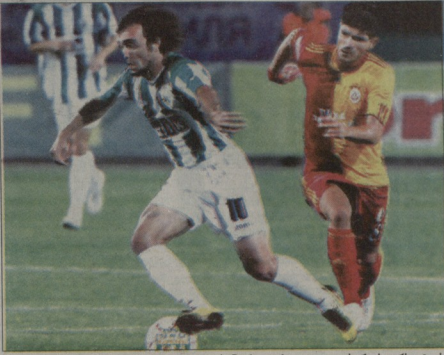
სანდერ ვერული ვალასარის კარს უტყვის

ივანეშვილი 21.00, ხალციხის რაიონული 21.00 (A ვაგონი); არსი-ბაღდატი 21.00, ლეგენდები 21.00 (B ვაგონი); ლეგენდები 21.00, ლილი-სორბინი 21.00 (C ვაგონი); ბრიკაბა 21.00, დინამო-ზოლინო 21.00 (D ვაგონი); ლეგენდები 21.00, დინამო-კაბატი 21.00 (E ვაგონი); ლილი-სორბინი 21.00, სპარტაკ-პალეო 21.00 (F ვაგონი); აგ-პალეო 23.05, ანდრეი-ბიტი 23.05 (G ვაგონი); ფეხბურთი 23.05, მუხტარბი-იანგო 23.05 (H ვაგონი); ფეხბურთი-მეტალურგ 23.05, ვინდოვნი-სამპლონი 23.05 (I ვაგონი); კარაბაგ-ბორისი 23.05, სევილია-სუბ 23.05 (J ვაგონი); ლეგენდები 23.05, ნაპოლეონ-ბურგუნდი 23.05 (K ვაგონი); ბუქარესტი-სტაია 23.05, ბორტო-რაბიო 23.05 (L ვაგონი).