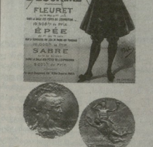
1900 წელი. პარიზი. მორცხვი ოლიმპიური თამაშების აზიბა და მინდაბა