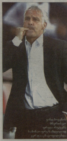
ენდრე ბეჭისი, მარტინ ილიის (სამსია) ორჯერ წამოვიდალ ვერ დასჯაერდნე

ნიდრავატი-გარსია-გარსიანი 1:0 გოლი: 1:0 ნოვტარსი (62)