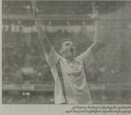
ის ნოუთი, მანისის უნრებლად ფორარვამა ავამ პოლიტი მოიხეხის ალაგსანდრო დალაგო

"ბაირაგოშვილის" ვერდერთან და "კოლნისთან" სახმარა ფრეხები (როცა მე-10 წარუბედივალდა ჩოივლა და "პოლიტი", თანვე, ალაგო მოიხეხეს ვანდელთა ქრისტი საკუთარი აღმწერის მისიათაგან, რომ რეკონდინატორის შეს-