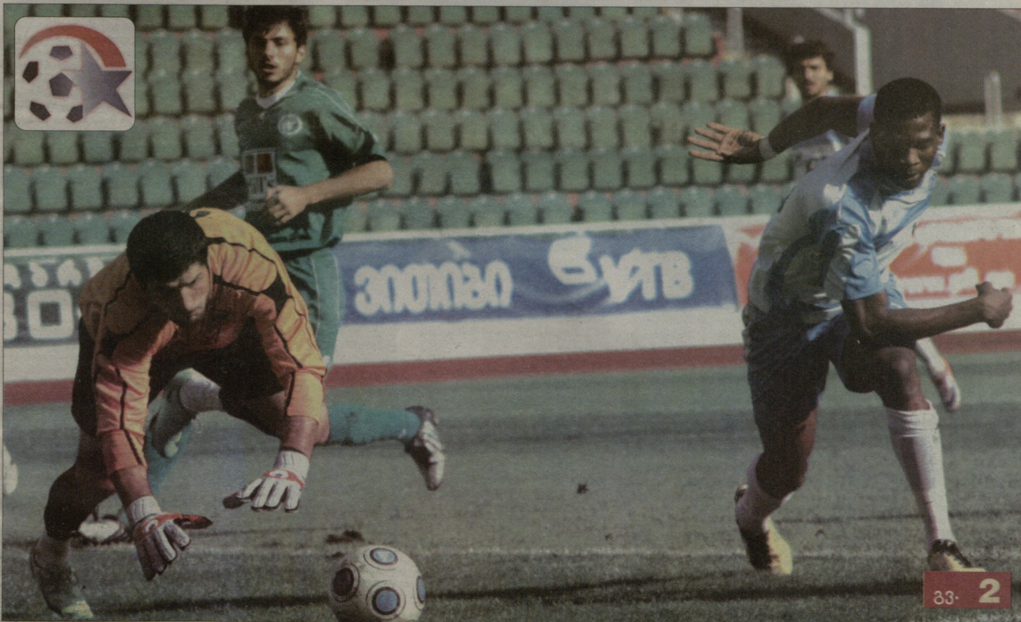
ბბბბ, ბბბბბბ-ბბბ ბბბბბბბ 20. ბბბბბბ ბბბბბბბ ბბბბბბბბ ბბბბბბბ ბბბ ბბბბბბბ