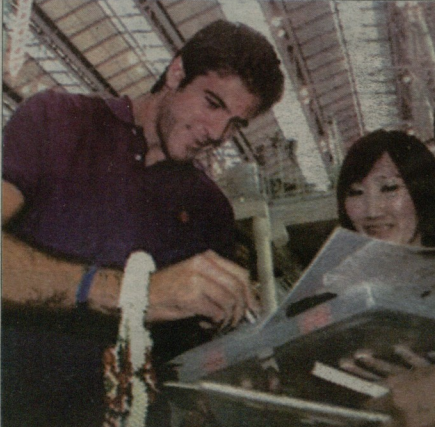
დელ პორტი ბანცესოკი