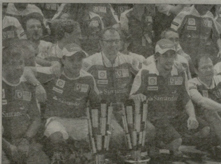
სადავლო ზედაზე მუშაობს ტრასის ხეობის