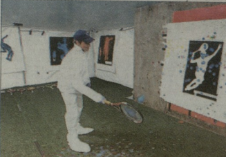
ვადგერიშ მუშაობის პროექტი