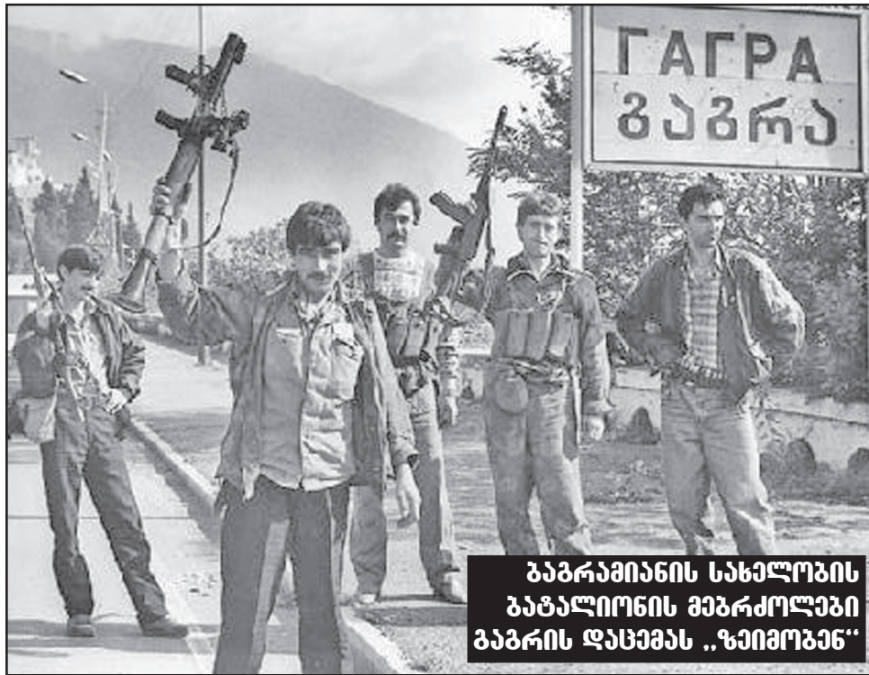
გაგრაშიანის სახელობის ბატალიონის მებრძოლები გაგრის დასვენებას „ზაიმოვან“

ალბათ არც ეღირობოდა მასზე გამომხატვრება, იმდენად „ჩვეულებრივი“, „რიგითი“ და ნაცნობია იქ ყველაფერი. სადავო ამ ორ მებოხელს, ილიას „ქვათა ღალადიდან“ მოყოლებული, გეჭონდა, გვაქვს და გვექნება. ამაში არც მოულოდნელია რამე და არც დიდად გასაკვირი. მაგრამ სომხურ პრესაში მომძლავრებული ანტიქართული გამოსვლების ფონზეც კი უმტკივნეულებსა (უპირველეს ყოვლისა, ჩვენი მოძმე და მეგობარი სომხებისთვის, თუ