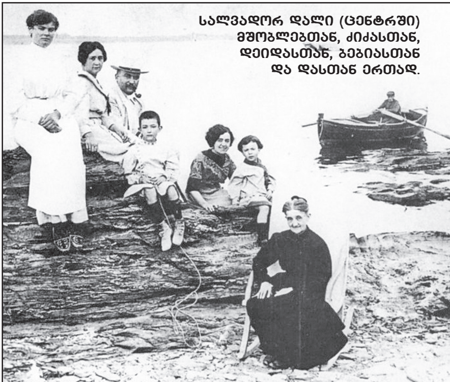
სალვადორ დალი (ცენტრში) ვმობლებთან, ქიქასთან, დეიდასთან, ბაბიასთან და დასთან ერთად.

სალვადორ დალის ცხოვრება არანაკლებ სიურრეალისტური იყო, ვიდრე იმის ნამუშევართა სიუჟეტები. სწორუპოვარმა გენიოსმა და იმისმა მუზამ – გალამ მთელი მსოფლიო აალაპარაკეს. ამ ორი ადამიანის კავშირი სამუდამოდ შევიდა ხელოვნების ისტორიაში, როგორც დალის გენიალური ნიჭიერებისა და გალას მკაცრი საქმიანი ფხიანობის ნაზავი.