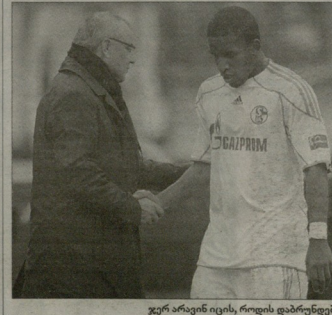
ჯარ არაინი იცის, როდის დაბრუნდება ფარგანი ფარგანი გუნდში