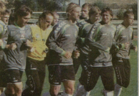
ლტვასთან იმედოვნებენ გამგებარეობაში

ლტვასთან მატჩი, თუკი თამაშობენ, 25 წლის ბორია ვალეროსისთვის სადებუტანტი იქნება ესპანეთის ნაკრები. მადრიდის "რეალის" აღზრდილი ესპანელი ყველა ასაკობრივი ნაკრები