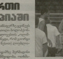
შერმადინი ყოფილ თანამდებობაზე უკმაყოფილოა