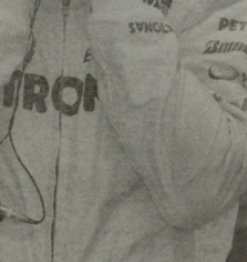
უნდა დარჩეს შუახან?

რა თქმა უნდა, ამერიკული დღეს ისეთი კონკრეტული რიანი არ არის, როგორც მიხვალს წინაშე დღეს. თუმცა იყო, თავი იცავ და დაევიწყება, რომ შუახანის რეგულაციულად არჩენდება თავის ბიზნესს 1996 და 2005 წლებში, როცა საკვირეული სინგაპურის კონკრეტული ნაშედეგობები. - სინგაპურის ქუჩებში შუახანის ისევე გამოიყვანება, როგორც მთელი წელი განმავლობაში. მოსახლეობის შესვლი-