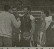
შერმადინი ყოფილ თანამდებობაზე უკმაყოფილოა