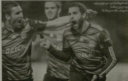
ატლეტისკო ლიანდროს ჩანაცვლება 15 მილიონი ევროს

ლიანდრო ლიანდროს უკვე საჯაროდ გამოაცხადა, რომ კიდევ ერთ სეზონს ლევა 1-ში არ დარჩება, მისი საჯაროული სატრანსფერი ვას 15 მილიონი ევროა.