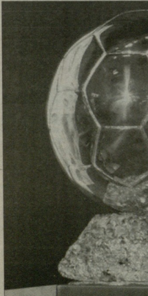
ოქროს ბურთი მფლობელი 2009

პარსული არგენტინელი ვარსკლავი დიეგო მესი მომხმეს, რომ მას "ოქროს ბურთის" მოგების ნაკლები შანსი აქვს. სპორტის ჩემპიონატზე წარმატება მჭერს ნიშნავს და ალბათ საბოლოო გადაწყვეტილების გამოტანის მიზნით.