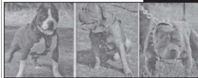
სახეობის საკუთრება, კანონით მკაცრად დაცულია...