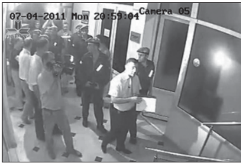
07-04-2011 Mon 20:59:04 Camera 05

21-22 ივნისს შინაგან საქმეთა სამინისტროს...