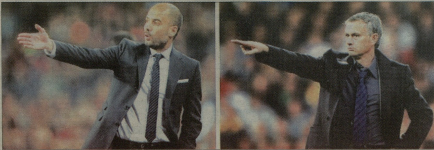
ორი დიდი მწერის დღესი ნინო

დღეს რომ „კამ ნოუზე“ დიდი მატჩია, მგინი, ნახევარზე მეტმა მსოფლიომ იცის, მაგრამ „ელ კლასიკოს“ მდიდარ ისტორიამ ძნელად მოხაზავი ისეთ დამაინტრიგებელ მუხებდრას, როგორც დღევანდელი ინიტე - „ბარსელონა“ „რეალის“ წინააღმდეგ, ხოლო გვარდროლა VS ფოხ მუორი-ნიო, ვინ უკეთესია, ლეო მესსი თუ კრისტინაო რინალო, ვინ იქნება ლიდერი პრემიერლიგისში.