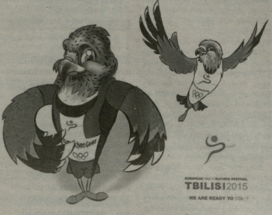
TBILISI 2015 WE ARE READY TO GO!