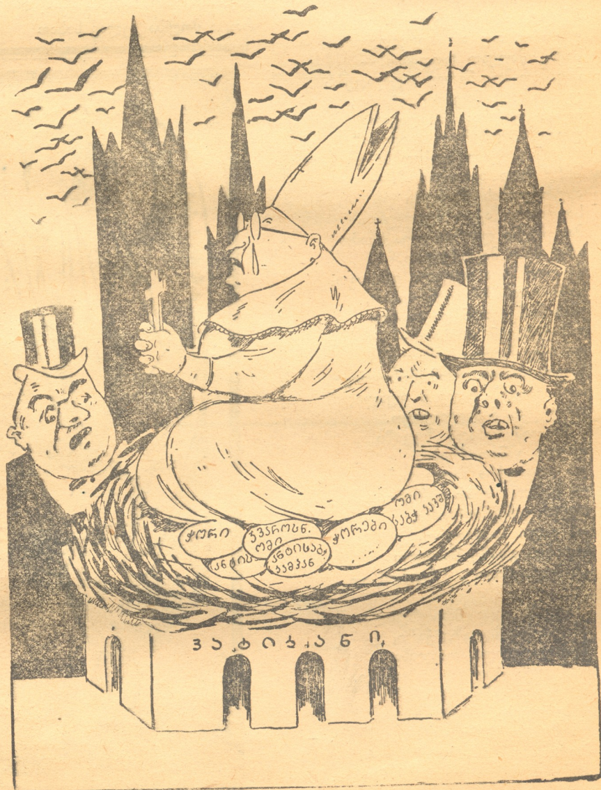
— კურთხეულია პაბი, როგორაა საქმე, მალე გამოჩეკავთ? — კვერცხები ლაყე აღმოჩნდა, არაფერი გამოდის!