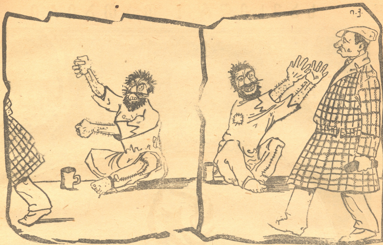
დაგექცეს ფჯახი... ჩემსავით გაგაგლახოს ღმერთ- მა... გაგიწყდეს ცოლშვილი... ჯოჯოხეთში აყეფდეს შენი მიცვალებულთა სული.