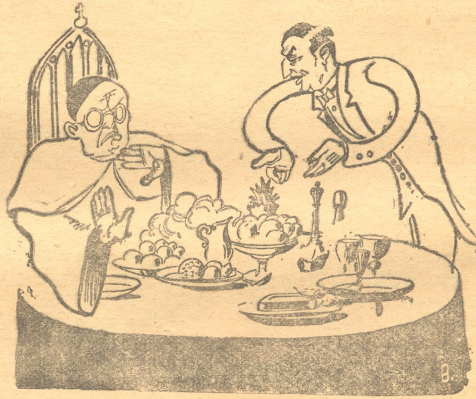
რომის პაპი (მსახურს): — უკანვე გაიტანეთ... ქანის მადა არა მაქვს.