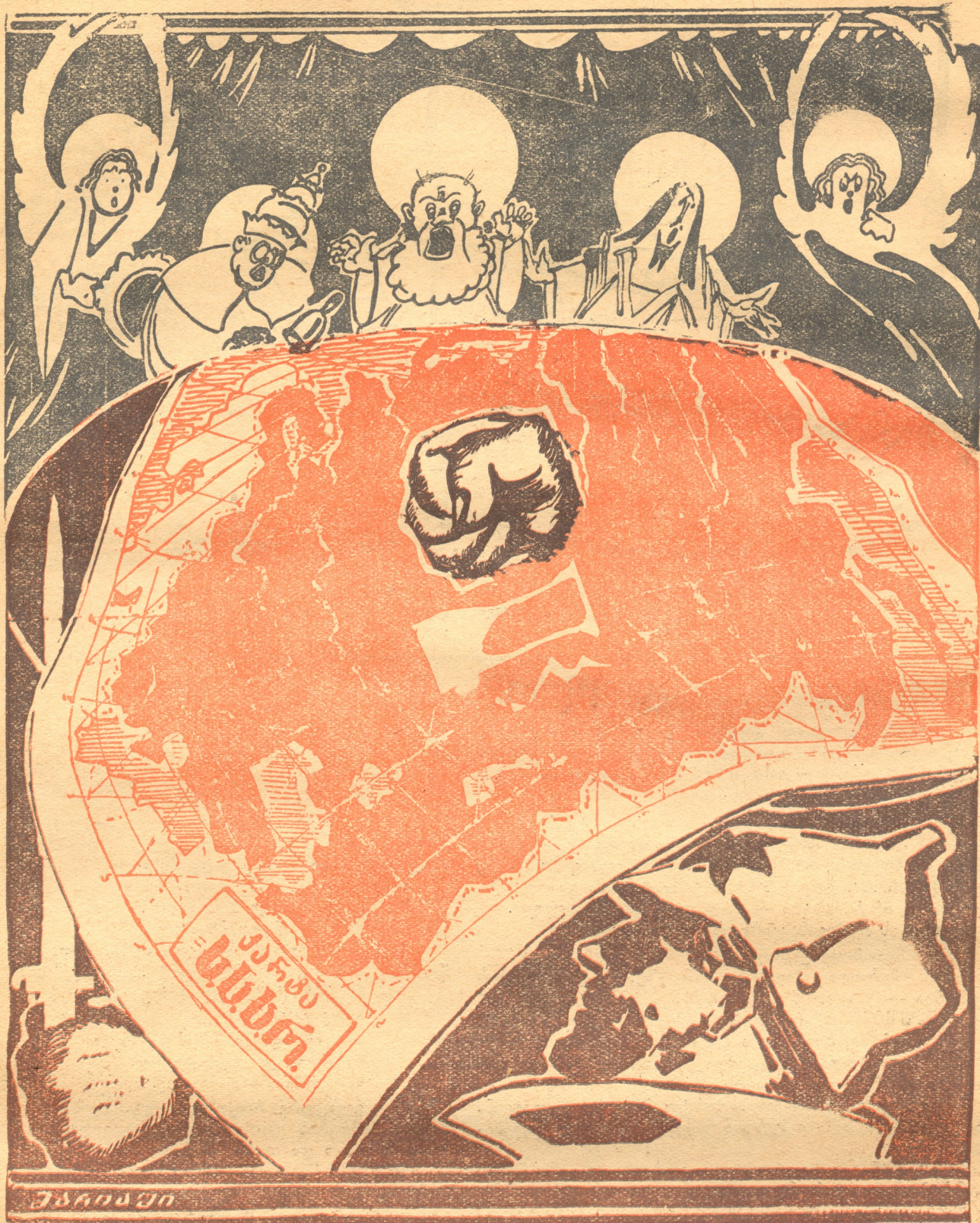
ს ა ბ ჭ ო თ ა კ ა ვ შ ი რ ი ს წ ი ნ ა ა ლ მ დ ე გ