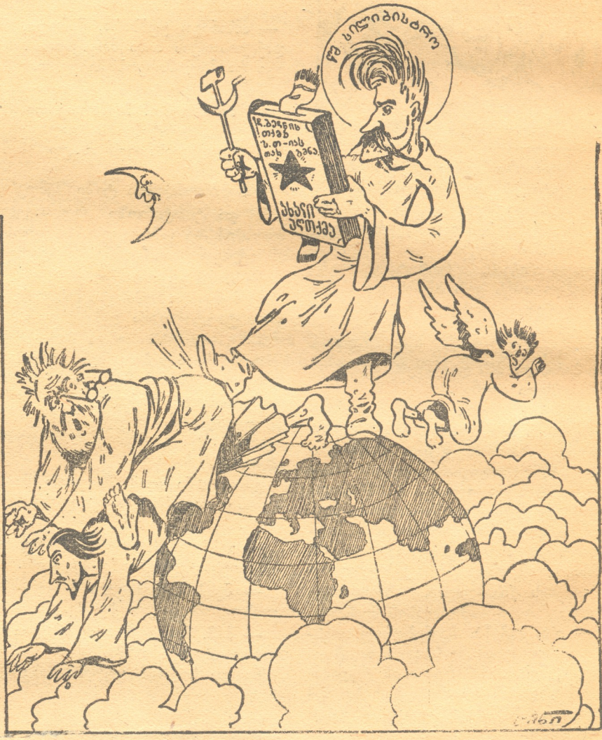
ღმერთები: დემიან და „წმინდა“ სილვამ შეგვიბრუნა სახარება, არც ცაში და არც მიწაზე არ გვადირსა განარება.

— ამ ყმაწვილმა ძან სიტყვები სთქვა, არ გეემტყუნება, ნასტავლი ვაცია, — მარა პეტრე მომისმინეთ. ე ჩვენი ეკლესია რო უპატრონოთ ლპება და მისი მომრები არც ბერია და არც ერი, არ ვარგა ასე. არც იგი ვარგა, რომ ექიმბაშ ღიპისთან დადიან სააქიმოდ. ღიპის მორჩენილი სულაერი მე არ მინახავს, რავარც მკვდრეთით ამდგარი ქრისტე არ უნახავს არავის. რა ასეთი მნელია იმ ეკლესიის დანგრევა და აფთიქათ გადაკეთება! ეს საქმე დასტურ უნდა მოვაქაზარკოთ ყაიდაში. ეს მინდოდა რო დამემატებია იმ პატროსანის სიტყვაზე. — დაუშმატა მოხუცმა. კრებამ მჭკობარე ტაშით დააჯილდოვა იგი! ბახჩო.