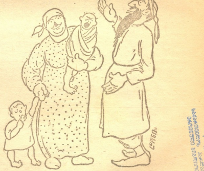
ცოლი ორი ვაჟიშვილთ შემომეგება.