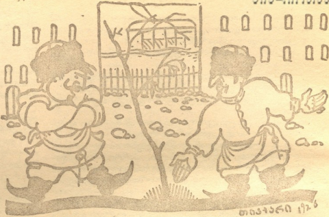
შეიძინებანი: ოპოი აქ ხე ამოხუდას... მოღა და გავხსნათ ამის ძირში რებტორანი-ბაღი?

ამ ბოლო დროს ჩვენს დაბაში მოხდა დიდი გარდატეხა. განდიდების მოტრფილივმ ზოგმა ფეხი წაიტეხა. აყვავების გზას დაადგა შრომაცემობი: გახსნა კლუბი. გინახა-ხის მოწოდებებს გამოციდის დროს მოსიდი ჩხუბი ბაზრის უკან უსუფთაოდ აღარ არის ერთი გოჯა. აღმასკომის თანამემწე ისე დადის, როგორც ხოჯა. სინან ქალაქი გაეკლუცდა, საეკლავა: პავედის სწორი. მოვაკრეებს დუქნების წინ სანამწერთ მოპყვეთ ღორი. ლექციები გაეცხშირეს, ყოველ ღამე არის კრება. გოჯე თუ ივლიანე ეპოს ჯავრითა ნელა დნება. პაველ შმაგი და ვალიკო აღარ ვიცით რას უყურებენ.