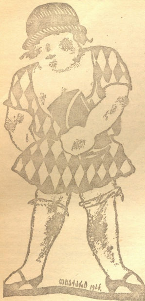
მით-მითი ნიშაში, თუ როგორ ბარ-მება მომჭირნოდა კაიროს მსოფრმებაში.