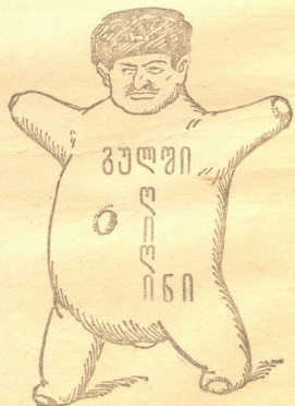
ორი ტიპი მატქს ახლო „მოღას“... ორვე მოკარს ვენაცვლებს. არავს ნაცვლად დღერი გამოიღის— ახე დაგვსუნი ვხვალს თავიანი. ცხოვრების ქალა უნდა ვართვა როგორც შეტენს—მეზამო, ჩემს სახლს იდეუვი (ხოლო არა სთქვას) მე ვარ „სპირტიბა“ მესინგ ნოე.

თუ მოაძერეს რიკზე კელი. ჯერჯერობით საქმე გააქვს სისახავლის ბეგრის ჩამდგენს. თუ კი შერჩა წინა ეშვი,— ვინ იცის თუ შევტენს რამდენს! ქორიკანთა ბოლო აქვს, ცნობებს აწვდის აგენტურა. თავმჯდომარედ თვითონ არის გაიმეგრა, როგორც ტურა. საეკვა რომ გავიდეს უხიფათოდ ბოლოს დონი, და დაადგეს ყელზე ყველა თვის საქმე სავიზიონი. მეთვან ხოლხტი.