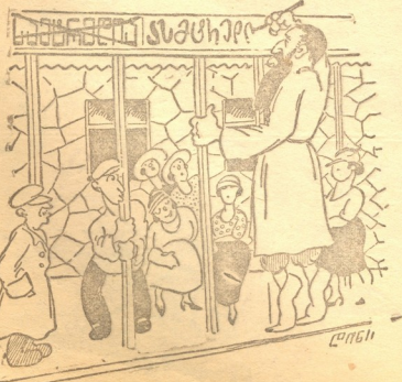
და სამტრეფიის ნაცვლად—ამბატრეფია დეაფურე.

— ნეტა დღეს რა დღეობა არის, რომ ამდენი ქალები გამოსულა-საღურთი?