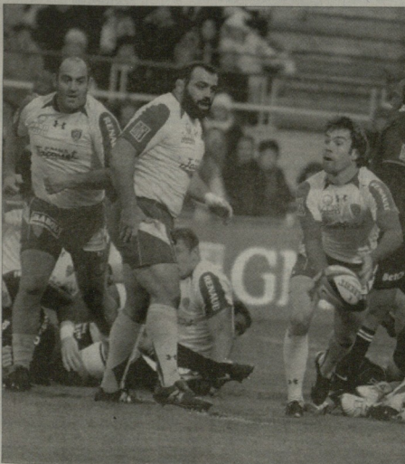
მარცხნიდან მეორე დეიტი ზორცემული, ზურთიანი მორგან პარა