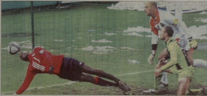
შუას სოსოს ლანის კარის ხაზიდან გატაცს თვითი