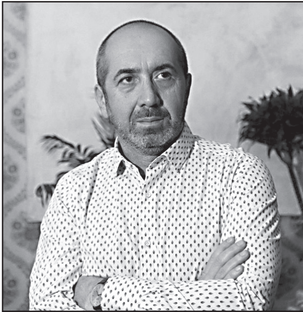
გიორგი მერაბიშვილი: „რატომ გაიქცა სალომე ზურაბიშვილი აგვისტოს ომის დროს საფრანგეთში“

– დაღუპული სამხედროების ოჯახებს არ აქვთ პრეტენზიები. ისინი ამბობენ, რომ მათი შვილები მოკვდნენ საქართველოსთვის.