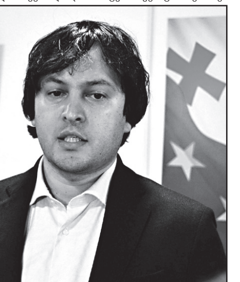
სომ პიარტექნოლოგიის ნაწილია, გაიხსენა ყოფილი საგარეო საქმეთა მინისტრი, მაგრამ ვერ გაიხსენა მისი გვარი. მერე ტექსტებში მშვენივრად წერია ზურაბიშვილის გვარი.

– ნეტა რაში სჭირდება? თქვენ გჯერათ, რომ 2008 წელს პუტინს მერაბიშვილი ზურაბიშვილში შეეშალა და მისი გვარი ვერ გაიხსენა? ეს