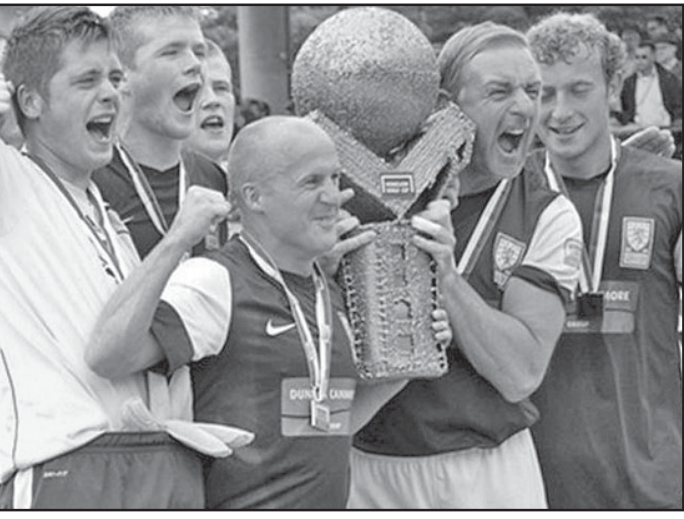
განსაღ უსახლკართო საიუბილეო X „მუნდი-ალს“ მხიპო უმასპინძლებს.

2003 წელს სოციალური პასუხისმგებლო-ბის პროგრამის ფარგლებში უფას ავს-ტრიის ძალბა გრაცში უსახლკართო პირ-ველი მსოფლიოს საფეხბურთო ჩემპიონ-ნატი მოაწყო და მას შემდეგ აღნიშნულმა პროექტმა არანა-ული მასშტაბი შეიქმნა. ამ ტურნირმა სტიმული მისცა ეროვნულ ფედერაციებს ანალოგიური შეჯიბრებები თავიანთ ქვეყნებში გაეხატათ. მართლაც, ყოველწლიურად სარგებელზე 30 ათასზე მე-ტი „კომპი“ გამოდის, ხოლო შემდეგ მონა-ნიშნულთა 70 პროცენტი აღიარებს, რომ მათი ცხოვრება გაცილებით საინტერესო გახდა. ახლანდ პარიზში მიტყნა უნიკალური სოციალური ღონისძიება დასრულდა, რე-მეზობლები 64-მა გუნდმა გაითავაზა. მათ მარსის მოუდანზე, ეიფელის კოშკის ჩრდილოეთი გადართილი 300-ზე მეტ ბრძო-ლაში გამოავლინეს უძლიერესები. გაუწყობთ ფინალური შეხვედრების შე-დეგებს.