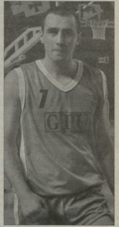
37-ე ტურა რომ ჩაგვადე, მაშინ მითრეს - რეკორდიანი გამებრად, თუმცა გაბრუნებით გაიმარჯვებულ სიხარული სულ სხვა იყო.