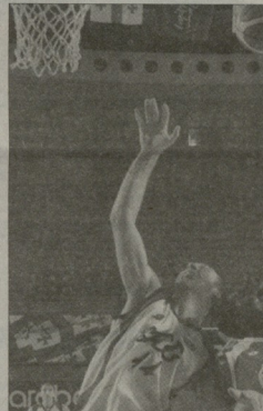
ამ შეხვედრაში ჩემი აგენტობა ფულივით ტუტებით შეიჯიფა, რომელიც აქამდე ვიცნობდი. მისთვის მან გამიჩინა რეკორდული და მოხარული ვარ, ასეთ კლუბში რომ მივხვდი...