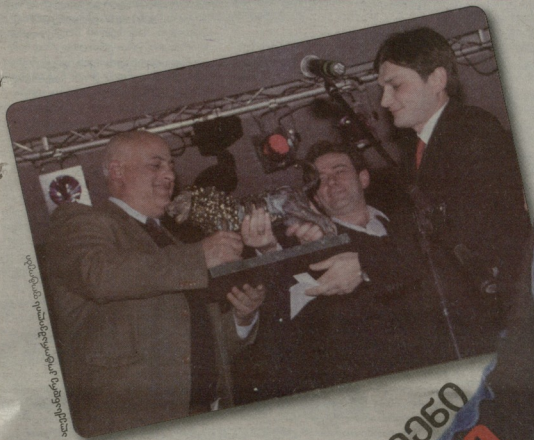
საქართველოს ფეხბურთის ფედერაცია