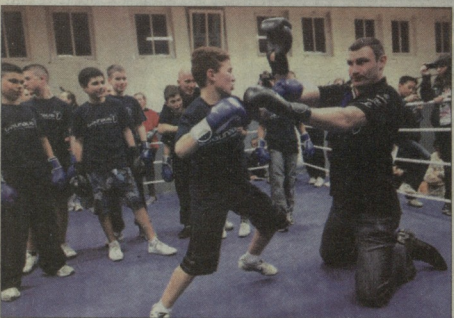
კლარკი და მომავალი თაობა