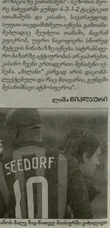
კასანის მალე მავრისთვის მავრისთვის