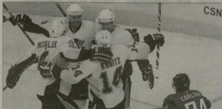
ტიმსტორმა კლასიკა მოიპო