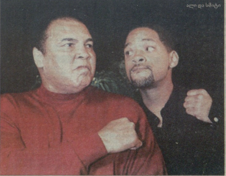
ულსი და სიტსი

ითითი მსახიობმა ამ ბრძოლისთვის შესაძლოა, მილიონი დოლარი მიიღოს, თუმცა ვერჯერჯერობით უცნობია სიტსა და უოლტერსის რეჟიცია ამ იდეაზე. უნდა აღვნიშნო, რომ მსახიობები სხვადასხვა ნომით კატეგორიას განეკუთვნებიან ულ სიტსის სიმძლავ 188 სანტიმეტრია, მარკ უოლტერსისა - 175. ასევე შეგახსენებთ, რომ სიტსს შუამდგომლობს იავეს მსურველები ფილმი „ალ“, ხოლო უოლტერსმა მიკი უორდი განახიბურა „მებრძოლი“.