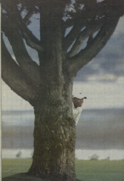
ტაივერ ფულსი 110-ე ამერიკის ღია პირველობაზე (კვებლ შირი, კალიფორნია)