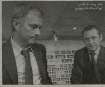
გახანარა თუ არა ვალდანიომ ვიხე?

მადრიდის "რეალის" გენერალურმა დირექტორმა ხორხე ვალდანიომ განაცხადა, რომ იანვარში კლუბი ერთ ფეხბურთელსაც არ გაყიდის. არამზუნდებიან ფეხბურთელებს განსაკუთრებით გაამაგვილა ყურადღება გკას შესაძლო გასტუმრებზე და ამის შესახებ ვაგროსცხა. იანვარში "რეალი" წაყლის კანდიდატები არიან კაკე, სერხიო კანსელისი, მამადულო დიარა, ლასანა დიარა და ესკოკოლ ვარი. ვალდანიომ აღნიშნა, რომ ეს ხუთივე "რეალი" არს.