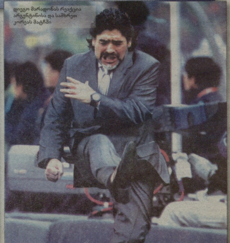
დიეგო მარადონას რეაქცია არგენტინისა და სამხრეთ კორეას მატჩში