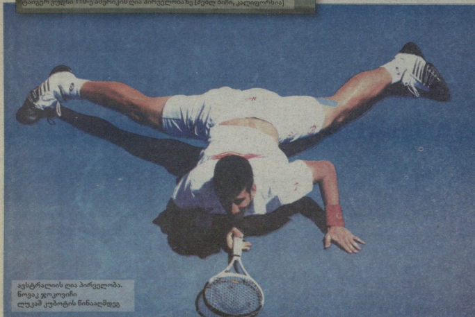
ავსტრალიის ღია პირველობა. ნოვაკ ჯოკოვიჩი ლუკაშ კუპოტის წინააღმდეგ