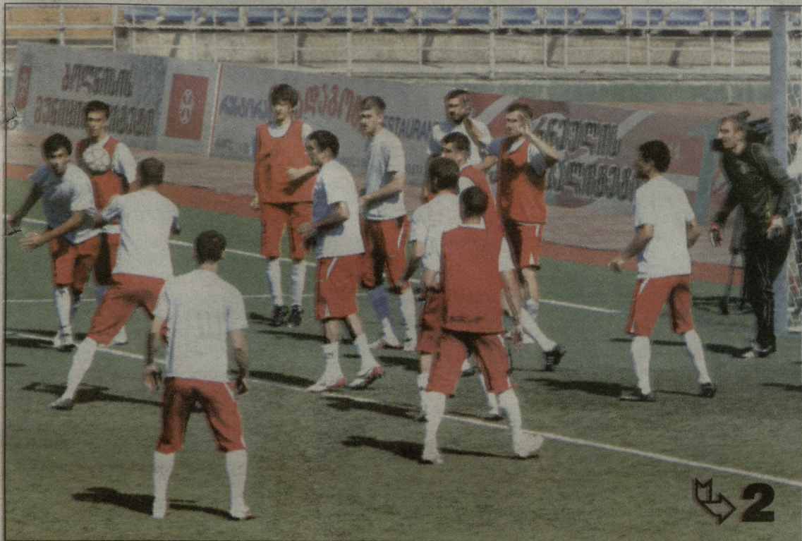
მეტალურგის გუშინდელი ვარჯიში ფოლადზე