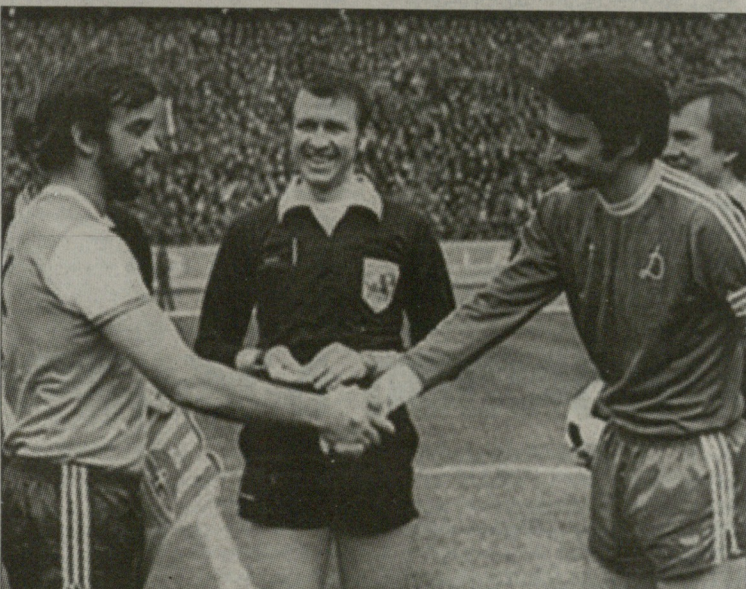
თბილისი. 1981 წლის 8 აპრილი - ევროპის ქვეყნების თასების მფლობელთა თასის პირველი მატჩი...