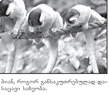
ბიან, როგორ განსაკუთრებულად დასაცავი სახეობა.

ნაშავეები არიან და პასუხი უნდა აგონ, - განმარტა დალუშის მამა.