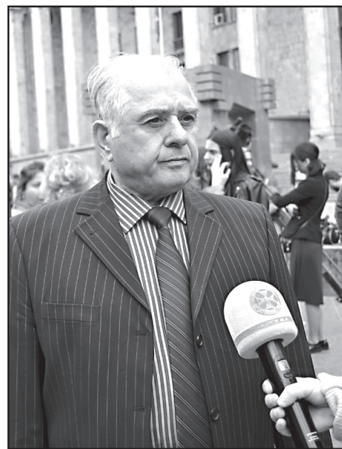
ლოვანი პოზიცია დააფიქსირა.