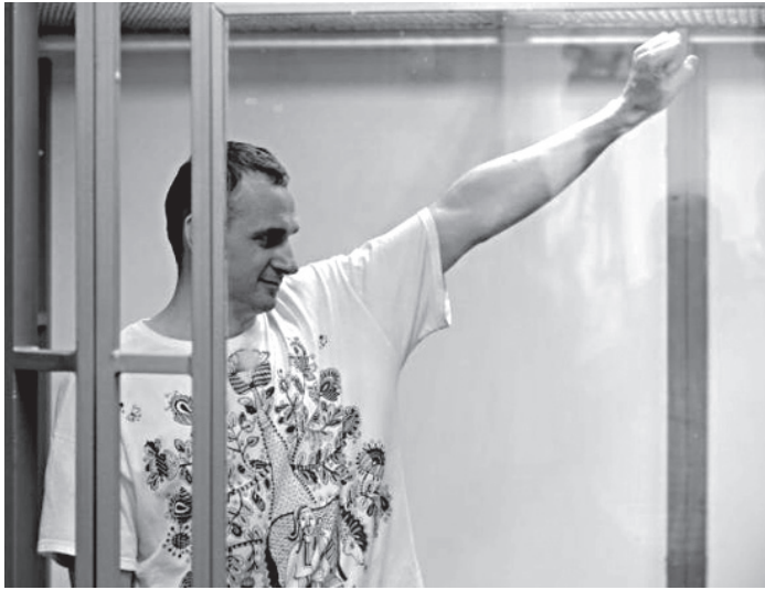
რეო საქმეთა სამინისტროს წარმომადგენელმა მარია ზახაროვამ. დღეს უკრაინელი ხალხი დამოუკიდებლობისთვის იბრძვის. პატიმრობაში მყოფი კინორეჟისორი ოლეგ სენცოვიც ფრონტის წინა ხაზზე დგას, მან რუსეთის იმპერიის წინაშე ქედი არ მოხარა.

– ესაა პოლიტიზირებული გადაწყვეტილება! სენცოვზე მეტად პრემიას ნადეჟდა საგრჩენო იმსახურებდა, რომელიც ახლა უკრაინულ საპრობლეში იმყოფება, – განაცხადა რუსეთის საგარეო