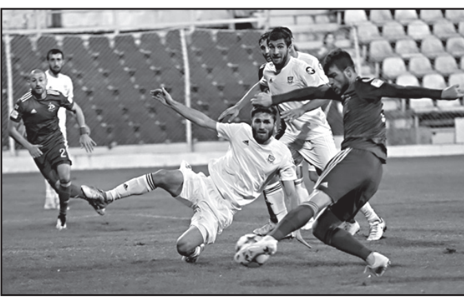
როის გათანაბრება მაინც ვერ შეძლო.