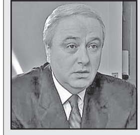
რისას განაცხადა: „სამართლად, მისივე სააკაშვილის ოჯახში სავსამსახურებთან ტრადიციულად თანაგმრობლობდა.“

საქართველოს უშიშროების ყოფილი მინისტრი იგორ გიორგაძე რუსული ტელეკომპანია „НТВ“-ს ეთერში აცხადებს, რომ ექსპრეზიდენტ მიხეილ სააკაშვილის დედა გიული ალასანია უშიშროების სამინისტროს აგენტი იყო. მის შესახებ მან რუსული ტელეკომპანია „НТВ“-ს პროგრამა „Новые русские сенсации“-ში საუბ-