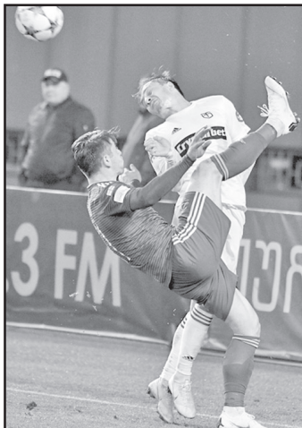
საილუსტრაციოდ შარშანდელი სეზონის ფინიშის გახსენებაც კმარა, როცა დიდუბეში ნამდვილი საფეხბურთო დრამა დატრიალდა.