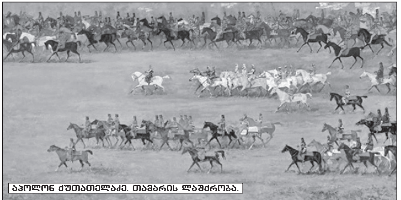
ახოლონ ქუთათელაქე. თამარის ლაშქრობა.