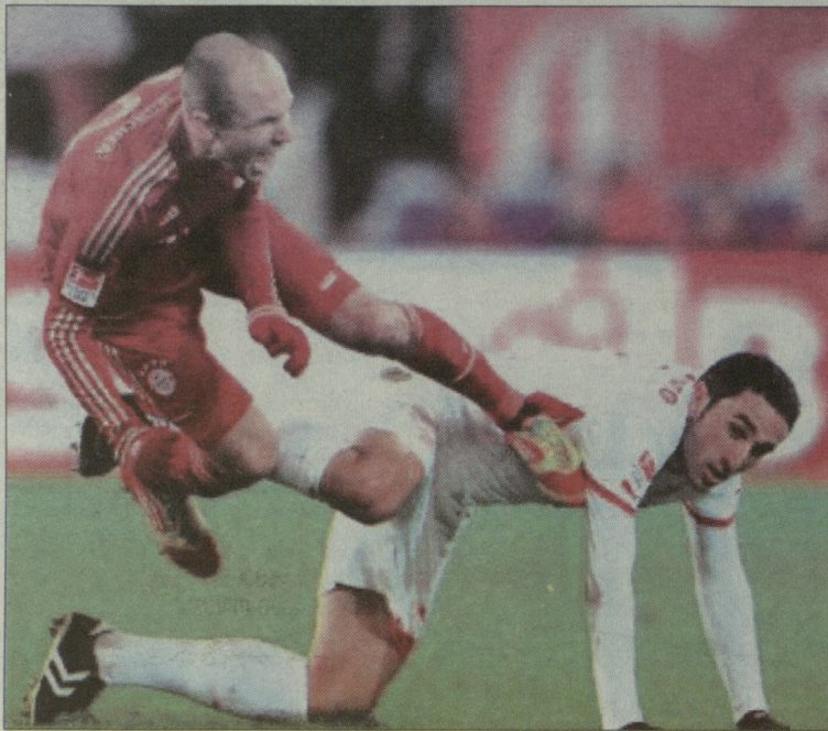
არიენ რობენის და კრისტიან მოლინაროს ერთ-ერთი ორთაბრძოლა

მოლინარო იტალიელია და სიმულანტებს კარბად იცნობს