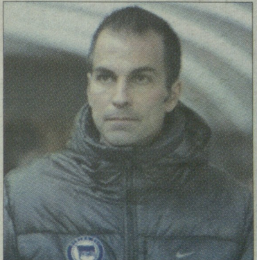
ბერლინში მარკუს ბაბელის გაშვება არ უნდათ, მაგრამ...

„ბილდი“ წერს, რომ ბუნდესლიგის პირველი წრის დასრულებისთანავე ბერლინის „ჰერტასა“ და მწვრთნელ მარკუს ბაბელის გზები გაიყოფა. ეს არის ინფორმაცია, რომელსაც ლევან კობიაშვილის კლუბის ხელმძღვანელები ჯერ არ ადასტურებენ, არადა, ბაბელის წასვლა გადაწყვეტილია. ბოსები და გულშემოყრელები მარკუსით, როგორც მწვრთნელით, ძალიან კმაყოფილები არიან და მისთვის ახალი კონტრაქტის გაფორმებაც სურთ, პრობლემა კი თავად ბაბელშია. მას „ჰერტასთან“ ახალი კონტრაქტის გაფორმება არ სურს, რადგან სავარაუდოდ უფრო სარფიანი შეთავაზება აქვს, „ჰერტას“ ხელმძღვანელები კი