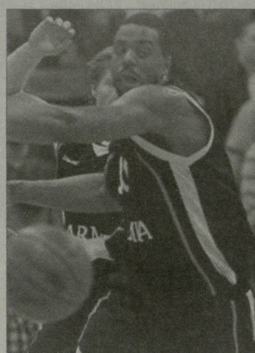
ლიც დაიმატა და სწორედ სათანადო შეთამაშების წყალობით მიაღწია ევროჩელენჯის მეორე რაუნდს.