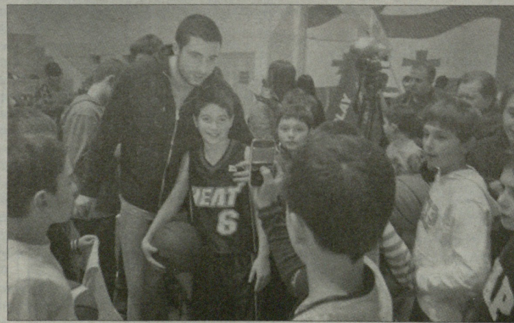
გუშინ საკალათბურთო აკადემიაში