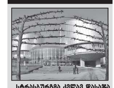
სტრასბურგში კვლავ დგასაქვ რუსეთი: მას მოუწევს, გადაუხადოს პატივმარს, ჩივრს ძალსა და უზავა ლტოლვილს