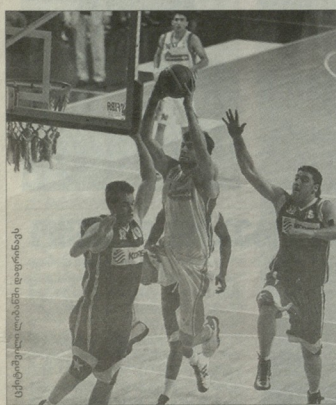
ცეტიმბოვილი ლაზიონში დიფენსაზე

„მარამბა“ B გუნდში პირველი მატჩი მასპინძელი ლიბანის „მუტავაქედან“ ჩატარდა და 106:73 გამარჯვდა. 28 წუთის ქართულმა თავდაცმულმა მატჩმა სტატორი ხუთჯერ იმდენი დანახა და ორმაგ დუბლიც 1 მოხსნა დააგდო - 15 ქულა, 9 მოხსნა, ვარდა ამას, მის ანგარიშზე 5 მედვიანი გადაცემა და 1 დფარება (24 წუთით).