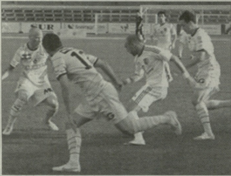
გოლიტ გოვლა მეტყუელა გარემოცვაში