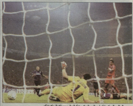
ინგლისი-ბაზელი. მომენტი, რომელმაც სან სარო მკითხა

საპარაული შოკო მავაცაზო რელი (4-2-3-1): კასილიანი - არბოლი, პეკუ, სეზონი რანბი, მანდანი - ხედიანი, ჩაი ალფონსი - იობოლი, კაკი, კ. რონდელი - ბენზი. სტა (4-2-3-1): ჩემპოლი - ა. ბურევიტი, კ. ბურევიტი, ინგინგინი, შტინიკო - კურნელი, მანჯი - მათევი, პონდი, მასა - დევი. ამიტრი: სტანკოვიჩი (სადრინგეთი) გოტფრიდ ლენცი