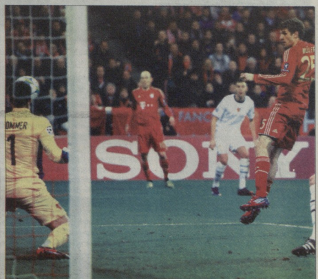
მაინი-ბაზელი. მოდერნი გოლი მუსიკალურია