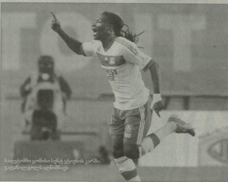
მედიტატი გომისი სწრაფი ტემპის კარიერაში...