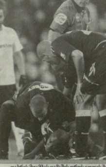
ფანების მუხამის თამაშის დროს გულს მუხამე დეგანია