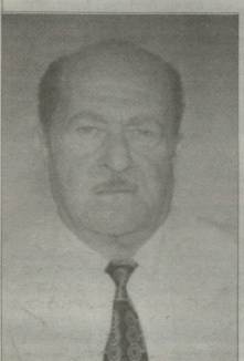
იმიღიანი განწყობილებაზე მოციხილის დღერთაში, ჩვენი იმპორ!