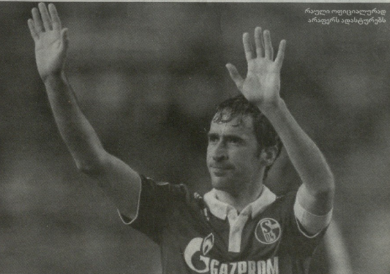
რადიო ფიციკლურად არაფერს დასტურებს