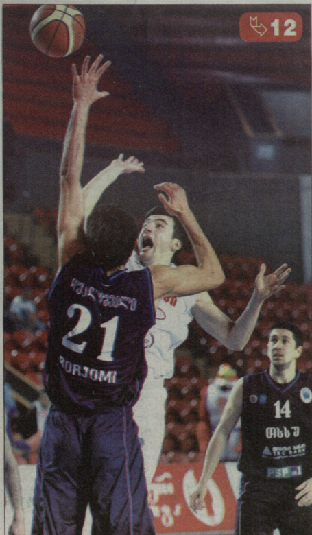
თამაშა ყულუმგეგამილის ფოტო