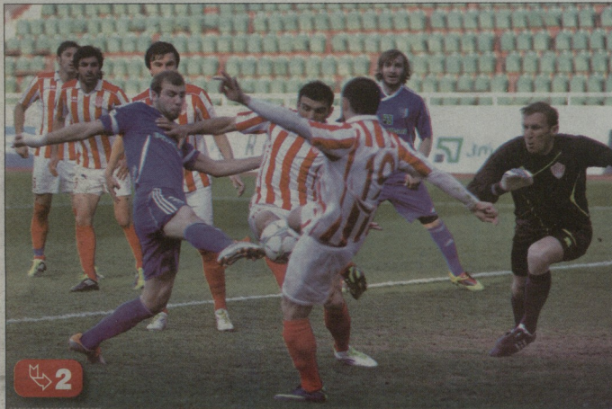
თამაშა ყულუმგეგამილის ფოტო