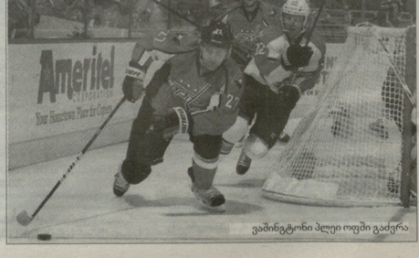
განმტვინო ბელი უოტე გავირა