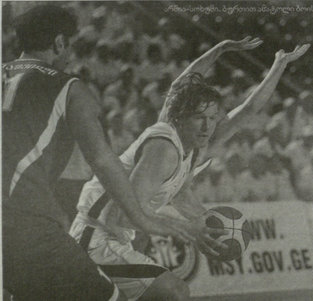
„მედიკოსების“ მატჩში ანტიკლი ბოის