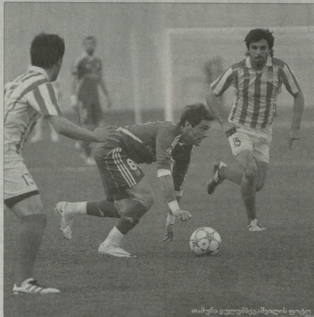
თამაში უკლებელე მონაქოელების ფოტო