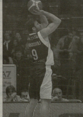
მარკო პოლიცია მილანში