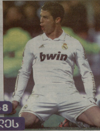
ფილიპ ლამა კრიშტიანო რონალდოს უნდა მიხედოს