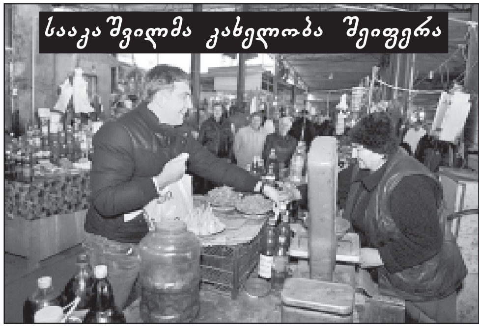
საკაშვილი კახეთში შეიფერა

და დაეშურთ თავი კახეთის ასალორძინებლად“.