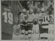
სტენი გილს ზეშობის