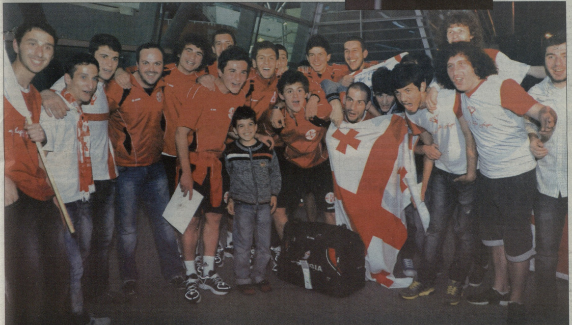
გუშინ 17-წლამდელები ნაცრებს თბილისის აეროპორტში ვულბოლი დახვედრა მოუწყვეს