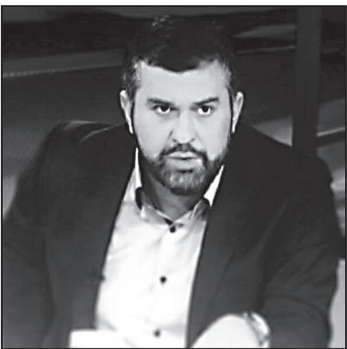
სასახლის აშენება კაპიუბი ჯდება. მთავარია, აუზში წყალი არ იყოს.

– ეროვნული ლიდერიდან ბიძინა ივანიშვილი ირაკლი სესიაშვილის პრარაბად გადაიქცა. ჩემთვის ეს ძალიან სამწუხარო ფაქტია.