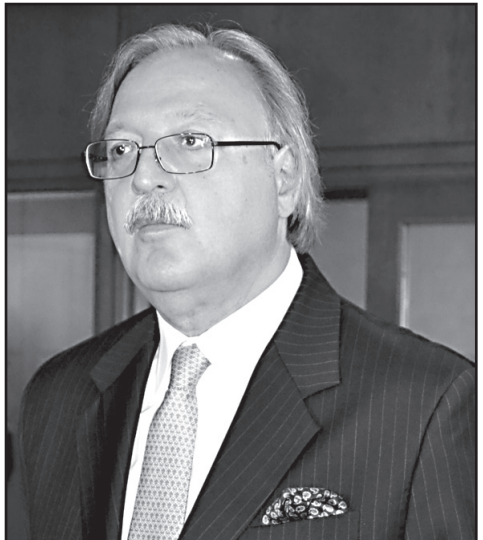
ამბობს, რომ დარბევას მწვანე შუქი სწორედ ჩუგოშვილმა აუწო.

– ეს მისი ბოლო ორი ინტერვიუდანაც გამოჩნდა. ამ ინტერვიუების შემდეგ არჩევნებზეც აისახა და „ოცნებამ“ მიწუს 5% მხარდაჭერა მიიღო. ბიძინა ივანიშვილს კიდევ ერთი ინტერვიუ რომ მიეცა არჩევნების წინ, დიდი გაყალბებების მიუხედავად, გრიგოლ ვაშაძე პირველივე ტურში გახდებოდა პრეზიდენტი.