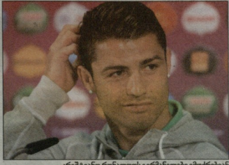
კრიმტიანო რინალდის გერმანდღული გუერტებან