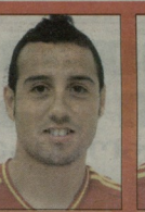
20. სანტი კასორლა ნახ. მალაგა 13.12.1984 168 სმ, 66 კგ 43 თამაში, 6 გოლი