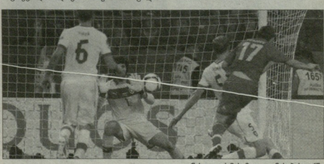
ლანდაცხურის მსაჯობის გოლი ჩეხების კარიბ

რუსეთის სრული დომინანცი და მასხურებულე ვადაცხადეა, ეს მისხინეგვია, რომელსაც კითხვის ნინიში უზრუნველ არ არსებობს.