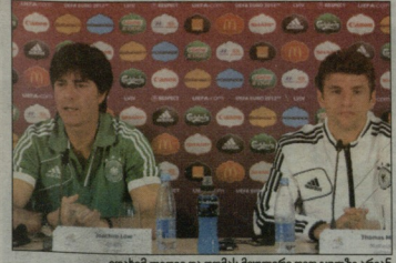
იოაზიმი ლილიე და თიმის მუღური დიდ გულე ზე არიან