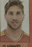
15. სერხიო რამოსი მცადა რაული 30.03.1986 183 სმ, 73 კგ 86 თამაში, 6 გოლი