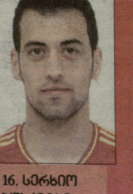
16. სერხიო ბუსკესი ნახ. პარსალონა 16.07.1992 189 სმ, 73 კგ 39 თამაში