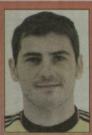
1. იკერ კასილიანი მცადა რაული 20.05.1981 185 სმ, 79 კგ 131 თამაში