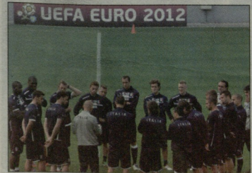
იტალიელები თითოს უიმედოდ არიან