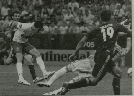
რობერტ ლეანდოსკი ამტარიდა კაცანანა

მსახი დეკანატიონის თითქმის მისი თამაში მანტის მომდინარეობის სასკეთს ვერცელეს - მისი რუსეთის სწრე ფეხბურთის თამაშიში, ბურთის კარად აკონტრო-