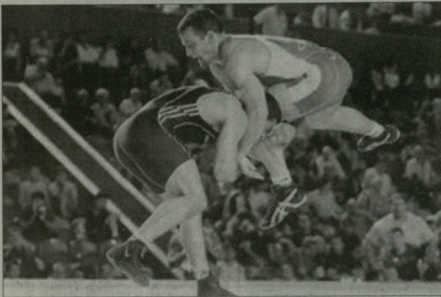
« 80-11 ბავარიისა »