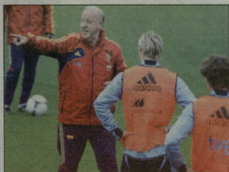
ვისინტე დელ ბოსკი ტიტულის დაცვას ინცებს