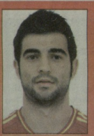
2. რაულ ალბიოლი მცადა რაული 04.01.1985 187 სმ, 84 კგ 34 თამაში