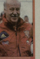
ვისინტა დელ ბოსკე მცადა რაული 23.12.1950