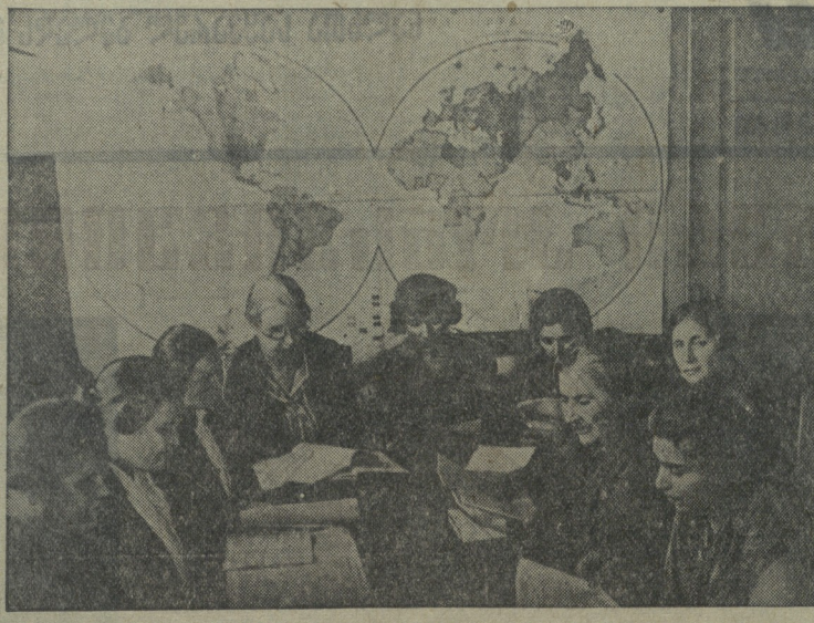
თბილისის ობლასტის სკანდალი...