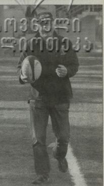
ლულის მთავარი მწვინელი ლულის მთავარი