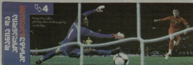
ლუკას პოდოლსკიმ ნაკრებში მე-100 მატჩში თავი გოლით გამოიჩინა