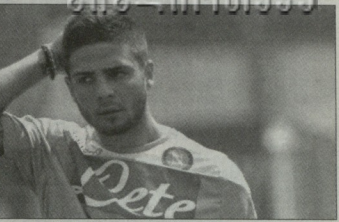
ლორენცი ინსინტი "ნაპოლი" დეპუტატი უიაროკი აღინაზნა