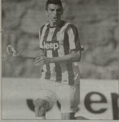
ლესიო პირველი მატჩი ჩატარა "იუვენუსის" შეხვედრებში