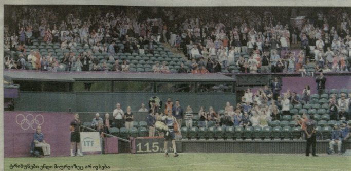
ტრიბუნები ენდი მორიჯიზეც არ იყვნენ