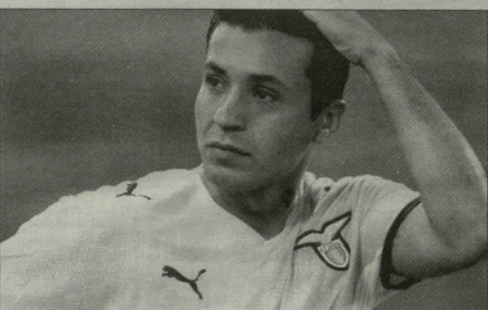
ფრანსელინო მათესალეში ლაკონი და არ თამაშებს