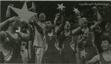
მედიის ფუნქციონირების ძირითადი ფაქტორების ხილვები - პეკინის ოლიმპიური რაიონების და ცერემონიების მსვლელები - ჩინეთის და იაპონიის მსვლელები იყვნენ. თუნც კვალფიკაციის ნაშენები შედეგების ასაკში, არც იაპონიის წარმომადგენელს ასაკზე ზომაზე მეტს შეეძლოა იყოს.

საკმაოდ უჩვეულო და ციხაზე არ იყო, ბუნებრივი ციხარაზე შექმნა. მსვლელები იაპონიის გამოსვლას ცხვილი დაბალი შეფასება მიესცეს. მუდგედა, პირველადვე გასული ჩინეთის ნაერტის კვლავი დღე ბრტანეთის ჩავიდა, ბრტანეთის მსვლელები უკრაინის სრული იაპონია მოითხოვეს დღარა, ეს განვალდა საუკუნო (ციფრების ვეღებში) არ დაუყოვნებლივ. იაპონელებმა პრეტენსია შეიტანეს, რის განხილვასაც რაიმეხნის წილი დასჭირდა. საბოლოოდ, ეს მათ გერმანიის მსვლელებს არუფერ, ბრტანეთის ბრტანეთის დასაყრდენად. ამ აშხის გამოხატვას, ცხვილი, მაყურებელთა გახიზნვით სტეფანი მოსეცა, მაგრამ მსვლელების გადამწყვეტილება უფერ საბოლოო იყო. ჩემპიონი ეს სრულიად დამსაყრდენი ბულიად ჩინეთის ნაერტის ცხვილი. საკვალფიკაციო ექსპანსივად განსხვავებით,