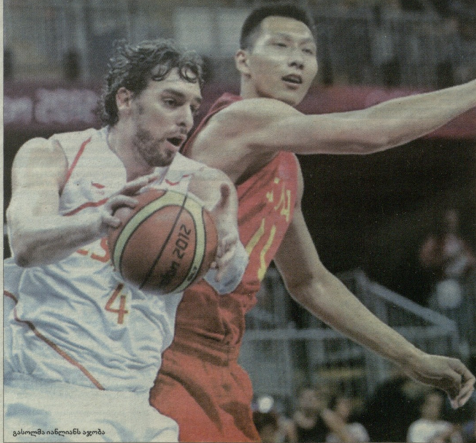
გასილმა იანლიანს ვაგობა