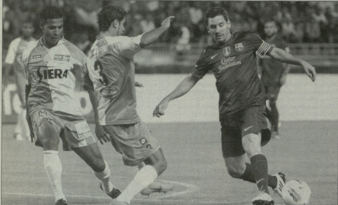
მისი ტანვარჯიში კვირით აღა

მისი აზრიკაშიც მისია, ვალენსია ტიტულს ფსვდა