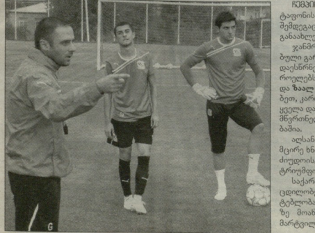
გორიტი კაპაპაოსკალაპი გუნდის საპაპაოსკალაპი ჩემპიონთა ლიგის ამზადებს

მატებით პრემიალორ თანხას ვერ მიიღებს - ჩემპიონთა და ევროპის ლიგის კვლევისკაცობა მოგვცას და ფრეზე უფე თანხებს არ ვასკელებ.