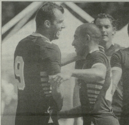
გორან პანდელი ლევერკუზენის ბაიერს გამარჯვების გოლი გაუბნა

"ქვევ ერთხელ დავრწმუნდი, რომ სწორი გზით მივდივართ და ასე უნდა გადავგრძელოთ. "ბაიერი" ძლიან ძლიერი