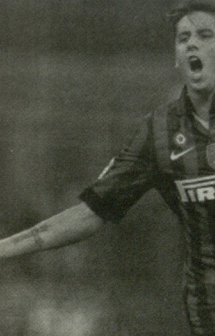
რეიკ ლავინის "ინტერში" რჩება

კარგად დელი "სარტომ" გაფორმებული ინფორმაციის თანახმად, "ნეპოლისში" მტკვიერება ვამბალიო პაციის შექვლელის ძიება დაიწყეს და თვლი მატრისთა პინილის დადაცეს. მიწლილი ფორარდი "კალიარის" ლორსება იცავს და უფლის ერთ-ერთი ლიფერად ითვლება აბტორიტეტული გამომცემის მტკვიებით, მიმდინებებს 2333 მოთხივებს სარდინილებსგან თანხის დასახლებებს და პასუხება 18 მილიონი ევრო მიიღეს - ლომბარდილი-თათის ეს მტკვიმტად ძვირი გამოდგება და ამ დროისთვის მოლაპარაკების მცირე რაუნდი მიმდინარებს, კულვარული ინფორმაციათი, მიმდინებები 10 მილიონის გადახდებს არიან ყავთეს. საბოლოო სიტყვა კუმბულებებს სურვილი, ნესიო, ამ სეზონის უაზროუს დღეებით უნდა მოუფრისა ხადელი.