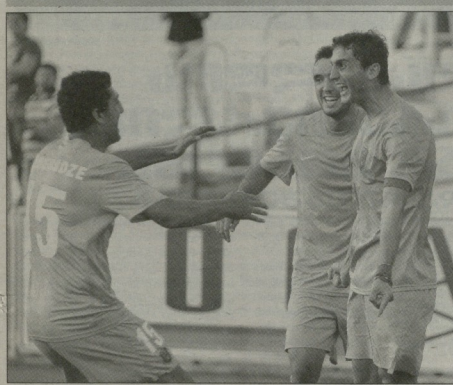
წლევიდელო ევროპაპაოსკალაპიდან ყველაზე მეტი თანხის მიღება კორის დილას შუქლია

პეროპაპაოსკალაპი-მონანელოპოპოთის უფე კლუბებს ანაზღაურებს ლაპის ყოველწლოურად უზრდის. თუ ადრე კლუბებს მხოლოდ ტრანსპორტირების თანხებს უანაზღაურებდა, მიმულ პლტისთვის უფას პრეზენტაციად არჩევის შემდეგ შემოსავლები მნიშვნელოვნად გაიზარდა და ლარისი ქვეყნების კლუბებისთვის ლაპის საარსებო წყარო გახდა.