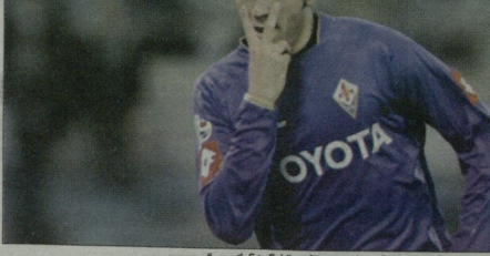
"ფორმირება" ვამპალი პაციენის დაბრუნება...