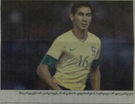
მილანელი არ უარყოფენ, რომ განისის გადაბრების სურვილი არ დაკავრავთ