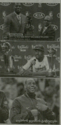
დანიელ ჯონსონის ტიტული

ბარბი იმის, რომ აშშ-ის ნაკრებმა შეთხზებულ მოთხრობაში ოლიმპიური თამაშების ოქროს მედალი, ამ გუნდის რანდომი ჯეინსონი იმდენად დაეჭვებდა.