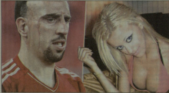
ფრანკ რიბერი და მეძვირე, რომელიმაც ბაიერნის ვარსკვლავს 2009 წელს ჰქონდა ურთიერთობა