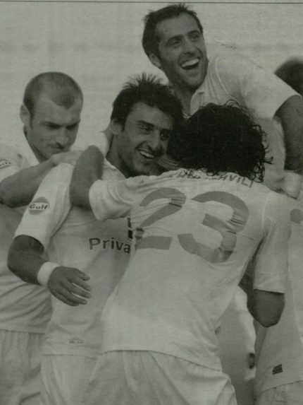
ღონაში მოკებიტი დაწრო