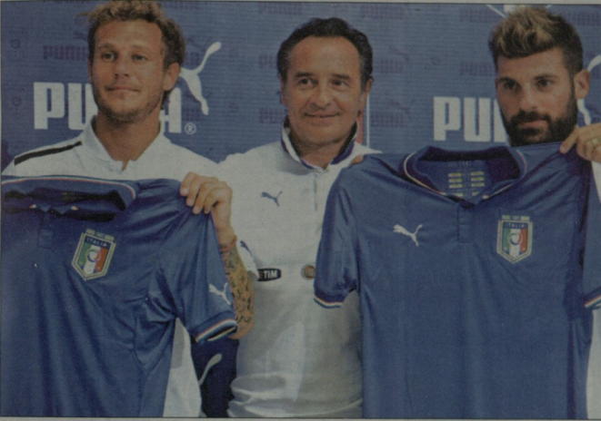
ძველი დიზაინი გაცოცხლებული ახალი ფორმა აღსანიშნავი დამამატებ, ჩვენარ პრანდელი და ანტონიო ნონჩერიანი წარადგინეს