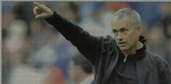
ყოველ მოუჩინო თავის სტიქიანია