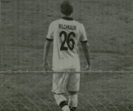
ხესტფორმას ბატრე მლჩრაუმს პირველევ მუტდრბარა ეტლოკანტს