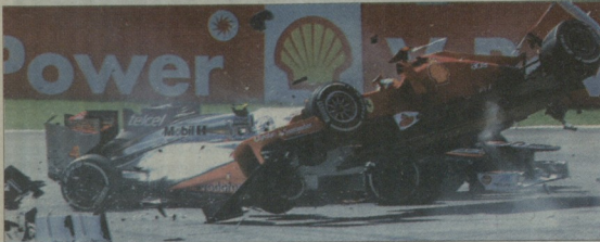
ვესტა ვენეზუელა გადარს