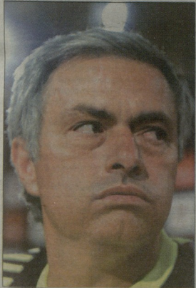
მადრიდის რეალის თავაკიე ვოზე მუორინო

მუორინო: კიდეზ კარგი, იუვენტუსიც ან ჯგუფში არ მოხვდა