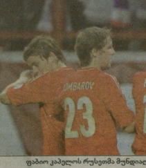
ფაბიო კაპელის რუსეთმა მუნდიალის მესამედი ტურნირი გამარჯვებით დაიწყო