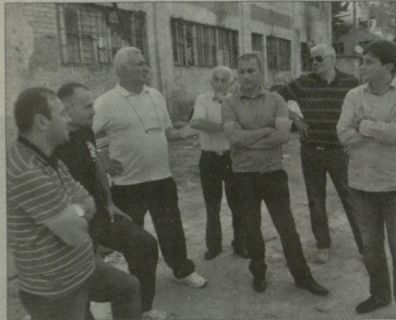
ქართული სპორტის ხელმძღვანელებმა მშენებლობა მოინახულეს