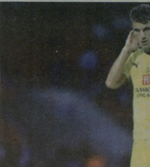
ბუნგლი კარიერას რუსეთში გააგრძელდა