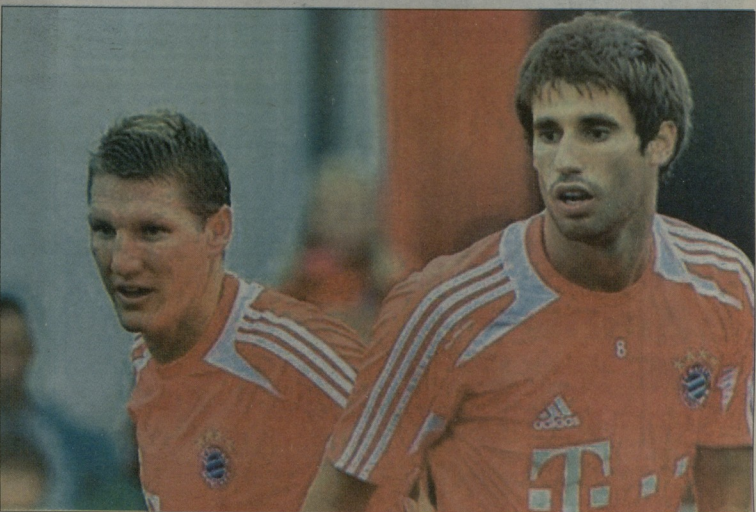
ბასტიან შვაინშტაიგერი (მარცხნივ) და ხაგი მარტინესი

„თუ ლუის ვუსტაგო ასე ვარჯიშობს, სასტარტო შემადგენლობაში არ ამოვადგამ!“ - ამბობს „დონ იუბი“.