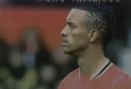
ნანი მანჩესტერში დარა