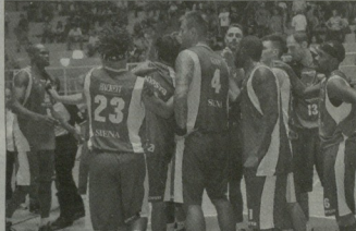
სანიკის (№13) პირველი მატჩი სინელთა მწვანე მათხარით

მწიფი, გერმანული ვაშლი ვოგასეთისა და სასარგებლო იქნა. ამ გუნდის მთავარი კარგი კლუბის მოქმედება უნდა შეწყვიტოს. როგორც თავად ამბობს, მისი მომავალი გუნდის მთავარ მალე შეტევილი.