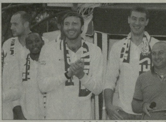
მანარევი კანტას პრემიერლიგის

2012-13 სეზონის სეზონში საქართველოს ჩემპიონი არამა“ ქვეყნის ღრუბლებს ცერბოსტის მუხარევი დაიგდა ვუნდი მუხარევი მუხარევი ეტაპში დასრულდა ჩემპიონობის ანტეგრეშინს“, ისრაელის „პაპოლის“ (მოლინი) და გერმანიის „ბონის“ ნინალდებები გატეხეს შედეგად.