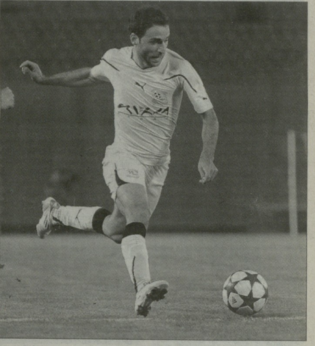
მარეჯა იმედი, გორის "ლილასთან" ათამაშებულ ფეხბურთში

"შახტაოვნის" ვულუმბატკიარცხება და ფეხბურთელებს იმედი აქვთ, რომ გუნდი ძალად ძველ ღონეზე ათამაშებდა. ოპტიმისტურად და განწყობილი იმეღრელი მცველი თუმარ ღონეძაც, რომელიც დღეს "ლელის" რესპონდენტია. – როგორ ფიქრობ, ბევრი ამორებს "შახტაოვნის" თამაშის ხარისხის სავარბნობ გაუმჯობესებამდე? – ვიქრობ, რომ მალე ყველაფერი დალვდება, თუცა პროფესიონის გარკვეული დრო მინც ვცხირებდა. ცხირისებზე ნარუმებტხლბა ასაბერეობამ და რამდენიმე ნამეგანი ფეხბურთელის წასვლა "შახტაოვნის" თამაშს დალი დავსება, თუცა ფეხბურთში ყველაფერი ხდება – აღსმელის ჩარცხდა მოსდეს, რას მუხეცდაც ისევ წინდის დრადება ხოლმე. აბსოლუტურად დარწმუნული ვარ, რომ მალე "შახტაოვნის" ძველ ღონეს ათამაშებდა, სამისოთიოლე ჩვენგანი მაქსიმალს აკვებს. ჩვენმა გუნდმა ფოთის საკმედი ხარისხიანად ითამაშა და დამახებურულად გათ